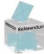
Rassemblement pour l'Initiative Citoyenne