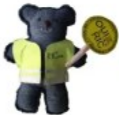
Capitale du RIC