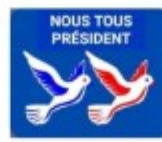
Nous tous Présidents