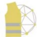
Gilets Jaunes Coordination