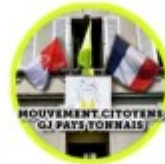
Mouvement Citoyens GJ Pays Yonnais