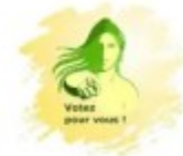
Votez Pour Vous