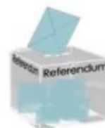
Rassemblement pour l'Initiative Citoyenne