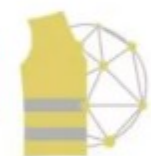
Gilets Jaunes Coordination