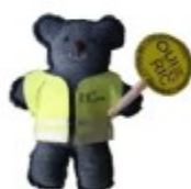
Capitale du RIC