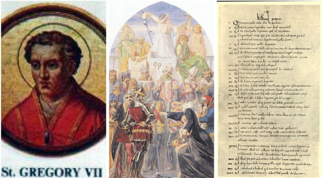
Image de Grégoire VII provenant de la Basilique Saint-Paul-hors-les-Murs à Rome /Spirit of Justice by Ford Madox Brown (1845) / Dictatus papæ, archives du Vatican

Pourquoi « Le Dictatus Papae » de Grégoire VII représente-t-il un moment fondateur en 1075, un tournant dans l'histoire de l'Etat moderne ? Le juriste Alain Supiot analyse comment l'autonomisation de la sphère juridique s'est transmise aux premiers états séculiers, nés de la révolution grégorienne.