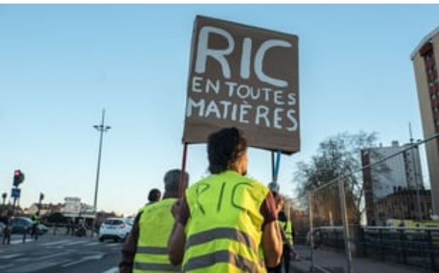
Lors d'une manifestation des « gilets jaunes » à Toulouse.

https://www.20minutes.fr/societe/2467595-20190308-toulouse-citoyens-vont-pouvoir-voter-dire-favorables-ric