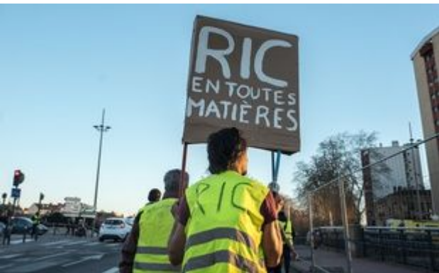
Lors d'une manifestation des « gilets jaunes » à Toulouse.

https://www.20minutes.fr/societe/2467595-20190308-toulouse-citoyens-vont-pouvoir-voter-dire-favorables-ric