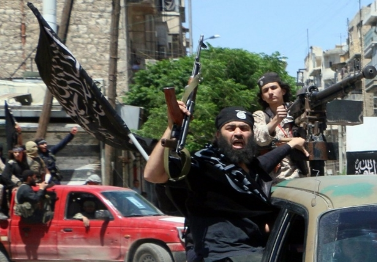
Des combattants du Front

al-Nosra traversent la ville syrienne d'Alep en mai 2015