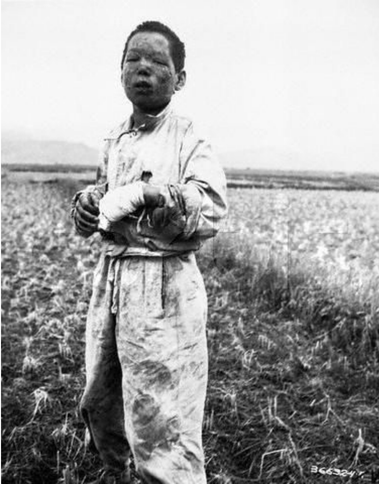
Enfant coréen brûlé par le napalm

Au sein de l'armée de l'air américaine, certains se délectaient des vertus de cette arme relativement nouvelle, introduite à la fin de la précédente guerre, se riant des protestations communistes et fourvoyant la presse en parlant de bombardements de précision . Les civils, aimaient-ils à prétendre, étaient prévenus de l'arrivée des bombardiers par des tracts, alors que tous les pilotes savaient que ces tracts n'avaient aucun effet. [6] Cela n'était qu'un prélude à la destruction de la plupart des villes et villages nord-coréens qui allait suivre l'entrée de la Chine dans la guerre.