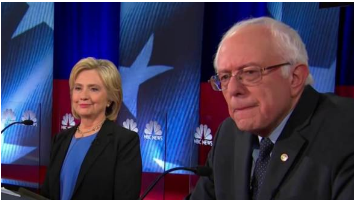
L'ancienne secrétaire d'État Hillary Clinton et le sénateur Bernie Sanders.